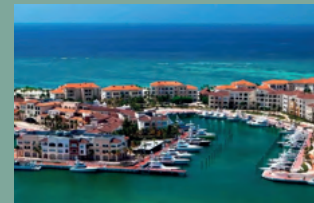
3. MARINA CAP CANA