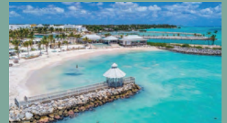
4. API BEACH