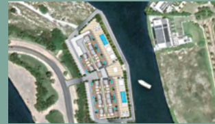
1. MARINA GARDEN