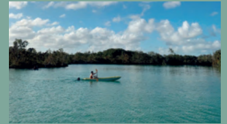
2. LAGO AZUL CAP CANA